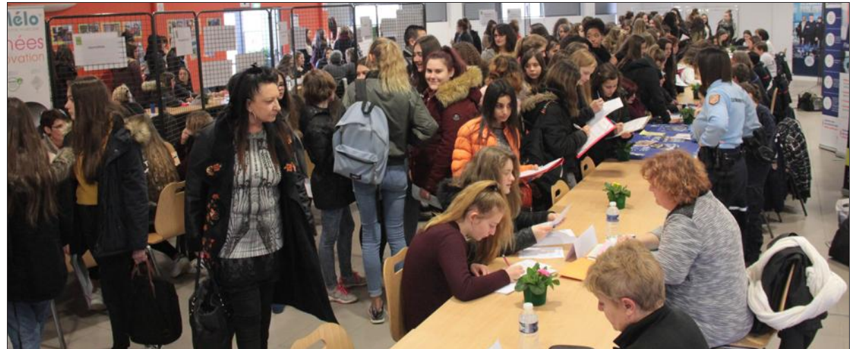
■ Plus de 700 collégiennes ont assisté au 13 e Carrefour des carrières au féminin, placé sous le parrainage de Flavie Bahaud, championne du monde d'aviron sur mer. La police, la gendarmerie, les pompiers et l'armée ont intéressé.

nes, avec ordinateur de bord. Tout a été très mécanisé. »